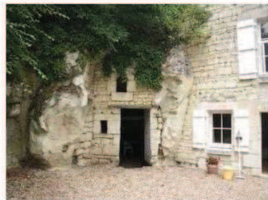
Photographie de la cavité