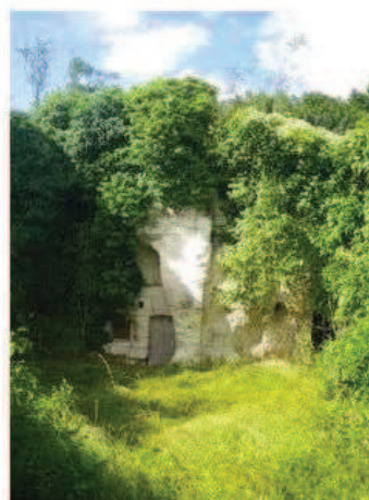
Photographie de la cavité