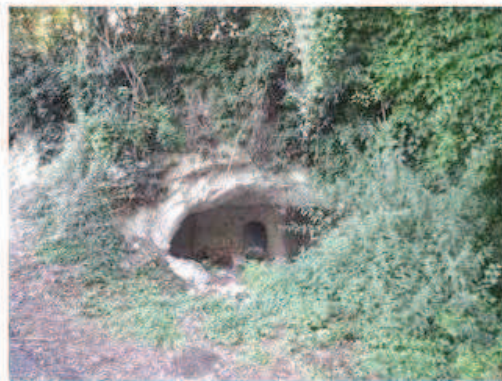
Photographie de la cavité