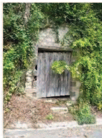
Photographie de la cavité

Moyen, roche altérée, fractures géologiques, fissures mécaniques