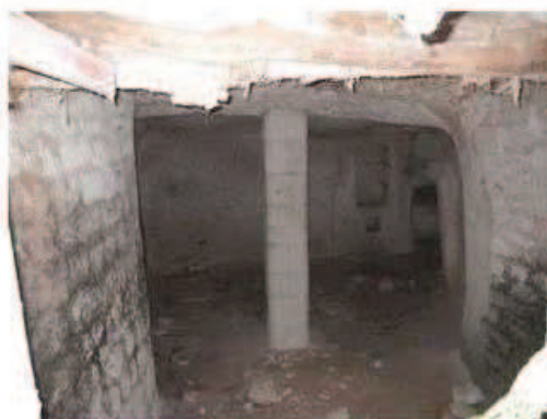
Photographie de la cavité