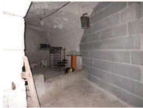
Photographie de la cavité

Mauvais, fontis et amorce de fontis, partie effondrée