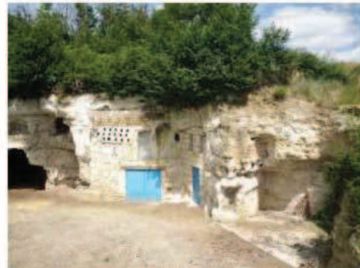
Photographie de la cavité

Cavité ouverte en surface suite au passage d'un engin, rebouché par la surface