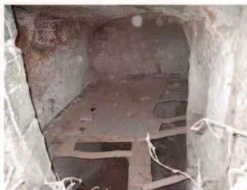
Photographie de la cavité