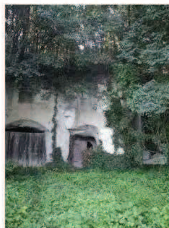
Photographie de la cavité