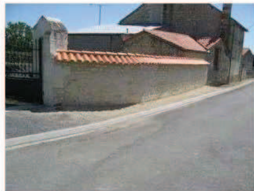
Photographie de la cavité