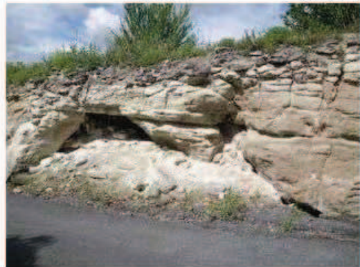
Photographie de la cavité